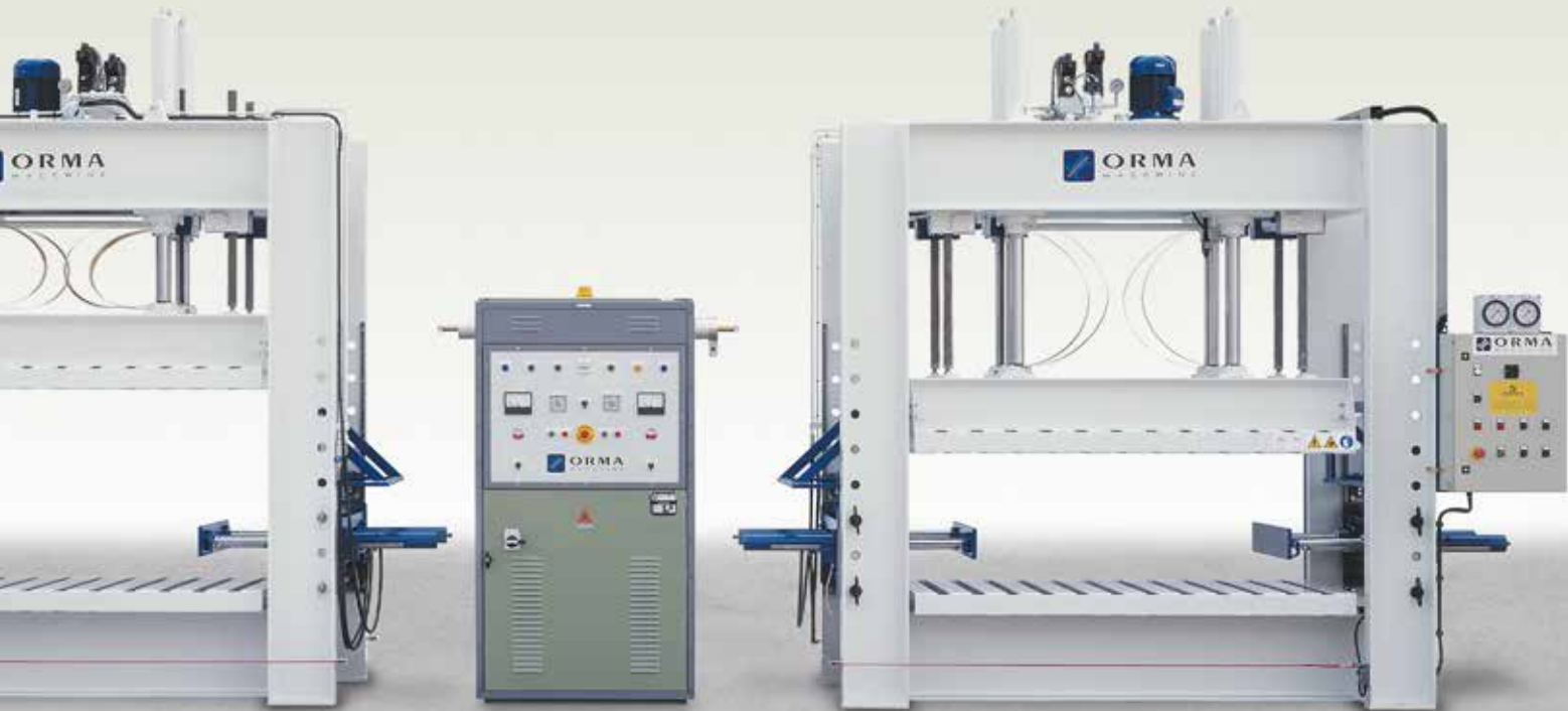
PFS 80/S + H.F.